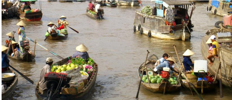
Delta du Mékong